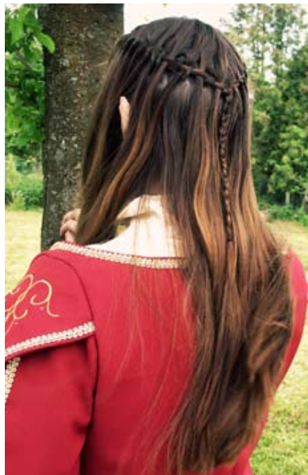
„Fairytale Waterfall“ Zopf