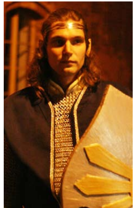
Atanon mit Kettenhemd

Man kann auch an die letzte Ringreihe ein schön geschwungenes Lederteil anbringen, das selbst aufwendig verziert ist.