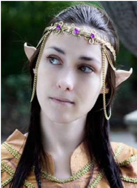
Lenora mit Diadem

Insgesamt sollte elbischer Kopfschmuck immer den Bezug zur gesellschaftlichen Stellung (z.B. Edler, Krieger oder Handwerker?) herstellen - Viel Prunk ist also nicht immer angebracht. Außerdem sollte dieser nie massiv wirken und zu eurem Typ, sowie der restlichen Gewandung passen. Es gibt zahlreiche Möglichkeiten im Netz - sogar bei Ebay - schlichte Diademe zu erstehen, die man mit etwas Eigeninitiative noch aufwerten kann.