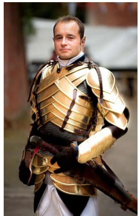
Nimgalad in Rüstung

Wie auch bei der Lederrüstung solltet ihr auf keinen Fall auf sehr historische Rüstformen zurückgreifen, sondern auf ein fremdartiges, körperbetontes, schlankes und formschönes Design achten. Meist zählt hier die Optik vor Rüstschutz - Achtet aber darauf, dass ihr das Maß nicht überschreitet und eure Rüstung tatsächlich auch noch einen Zweck erfüllt! Ein bauchfreies Plattentop ohne weiteren Schutz ist eher unangebracht, auch wenn man die Figur dafür hätte.