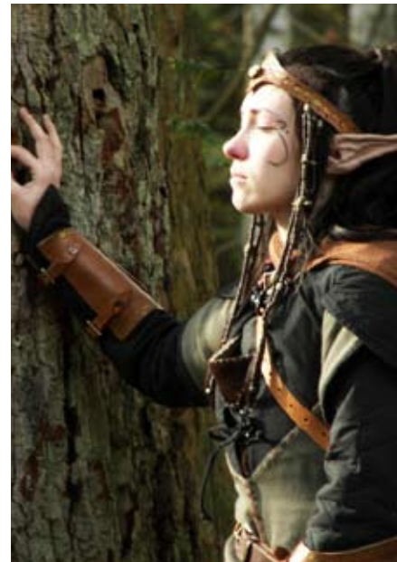
Eljisjah in Trauer um einen Freund

Eine andere Möglichkeit, wie ein Elb seine sterbliche Hülle verlässt, ist die bewusste Entscheidung. Hat er seine Pflicht erfüllt oder seinen Lebenswillen aufgrund schrecklicher Ereignisse (Leid und Trauer) verloren, kann er aus einer eigenen Entscheidung heraus dem Leben entsagen.