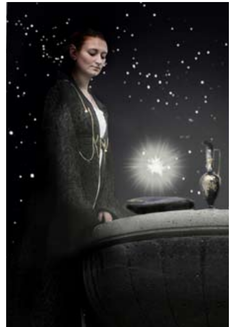
Geweihte sieht in die Zukunft

So ist jede von einem Aurerijahrrelben geformte Magie eine Mischung aus eigener Kraft und dem göttlichen Willen, der über die Vollkommenheit der gewirkten Kraft wacht. Es wird gewährleistet, dass das zerbrechliche Gleichgewicht der Elemente nicht gestört wird.