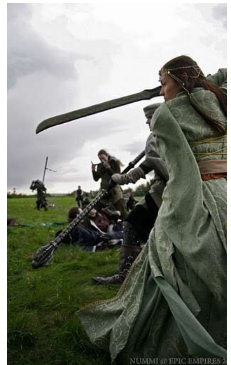
In der Schlacht (Lenora)

Im Gegensatz zu den finsternen Völkern empfinden sie dabei jedoch keine Freude, sondern sehen kriegerische Auseinandersetzungen als notwendiges Übel . Die Schrecken des Krieges können ein so langlebiges Wesen sehr prägen und man sollte sich als Elb gut überlegen, wann es angebracht ist, dies zu riskieren.