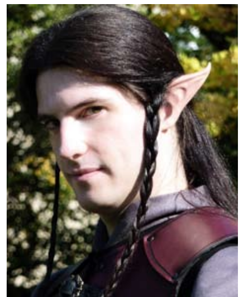
Kelen mit typischer Elbenfrisur

Ebay bietet dahingehend zahlreiche Wahlmöglichkeiten für wenig Geld. Man sollte allerdings darauf achten, dass sie eine gewisse Qualität aufweisen, gut sitzen und nicht nach Plastik oder Karnevalsperücken aussehen. Lasst besser auch die Finger von Perücken mit Pony oder starken Locken. Schaut, welche Form und Farbe gut mit eurem Typ harmonieren und seht von starken Farbtönen wie Grün, Blau, Gelb, Feuerrot oder Pink ab.