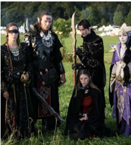
Aurerijahrspieler als Druchii-Gruppe

Wie schon zuvor genannt, geht es uns trotz dessen um den Spielspaß aller. Konfliktspiel gehört also durchaus dazu, darf aber andere Mitspieler nicht einengen oder zu einer bestimmten Handlung bzw. Konsequenz zwingen. Wir wollen Spielansätze bieten und reagieren auch gern selbst auf Spiel mit Feindbildern, gehen aber immer von einer gegenseitigen Rücksicht und Fairness untereinander aus. Wir spielen vor allem nach Opferregel.