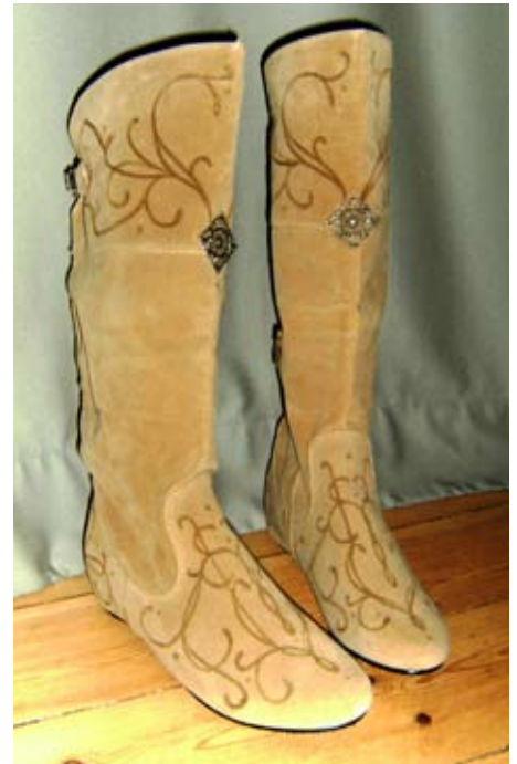
Lenoras Elbenstiefel aus verziertem Synthetikmaterial

Als Frau hat man den gewissen Vorteil, dass es oft bei diversen Schuhanbietern geeignete Ballerinas, Mokassins oder Stiefel in "Nostalgikoptik" im Angebot gibt. Auch auf dem Flohmarkt findet man viele Alternativen, die man leicht umarbeiten kann. Für die Männer gibt es dafür reichlich Larphändler im Netz, die günstige Ambienteschuhe anbieten, aber auch ab und an bei den bekannten Schuhhändlern passende Lederstiefel. Hier gilt meistens: Einfach die Augen offen halten. Tipps zu Händlern und Quellen kann die Gruppe bieten, falls ihr euch unsicher seid.