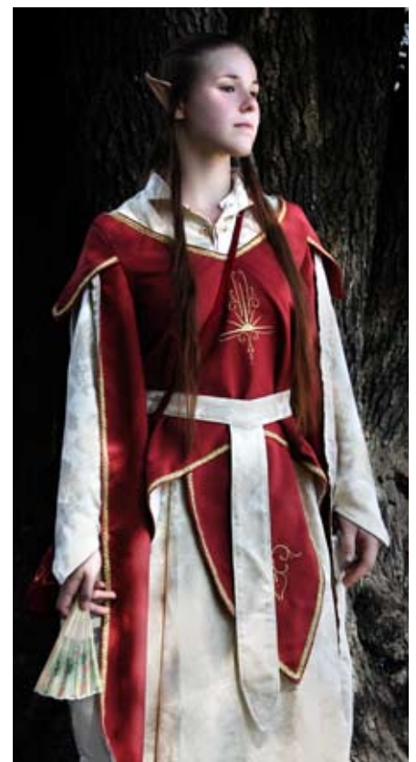
Vertraute der Königin (Resharja)

- Vertrauter - Diese kümmern sich um das leibliche und seelische Wohl eines anderen Elben: Sie helfen diesem beispielsweise bei kleineren, alltäglichen Aufgaben, leisten ihm Gesellschaft und begleiten ihn auf Reisen. Sie befinden sich stets in einer Lehrbeziehung zu ihrem Mentor. Gerade da sie sich um das Wohl anderer sorgen, gelten Vertraute als Edle unter den Elben.