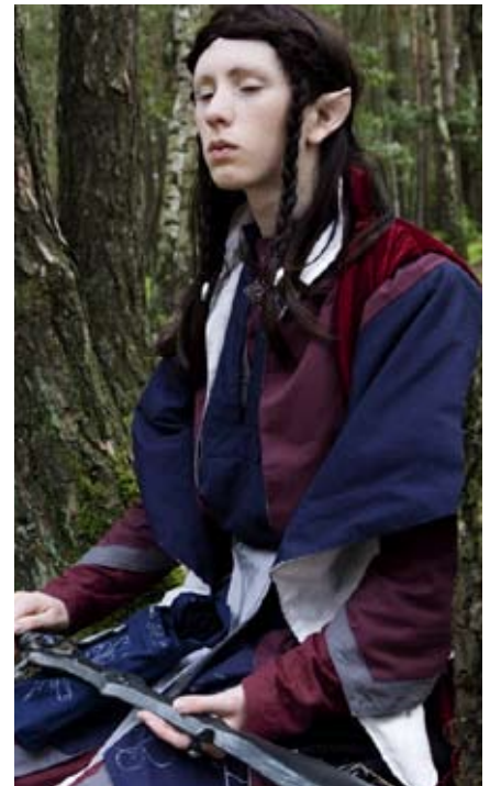
Vorbereitung für die Schlacht

Dies bedeutet jedoch nicht, dass sich die Elben in ihren Erinnerungen verlieren! Das Schicksal und die höhere Pflicht bestimmen die Zukunft jedes Aurerijahrelben und werden mit Stolz getragen. Auch das Bewusstsein eines Tages an die Seite der Götter zurückkehren zu können, bestimmt das Verhalten der Aurerijahrelben nachhaltig und lässt sie hoffnungsvoll auf die kommenden Zeiten blicken.