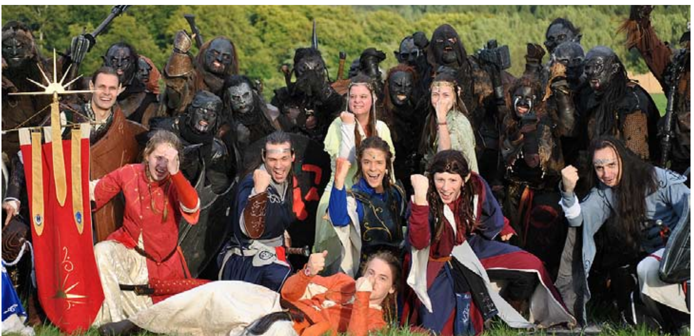
Spaß am Spiel miteinander - Elben und Orks auf dem Epic Empires 2010

(weitere Informationen zum Spiel mit Feindbildern unter Punkt 5)