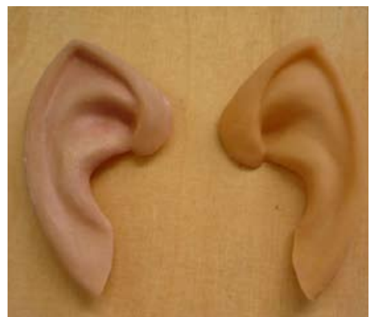
Geschminkte und ungeschminkte Ohren

Weiterhin ist das Abschminken der Ohren unumgänglich, denn sie werden vom Hersteller meist mit einem auffälligen Gelbstich geliefert. Der Aufwand hält sich in Grenzen, erzielt aber ein tolles Ergebnis und unterstützt die Illusion vom "echten" Elben. Zum Abschminken könnt ihr Schminke auf Wasserbasis verwenden, aber auch ganz einfaches Make-up aus der Drogerie.