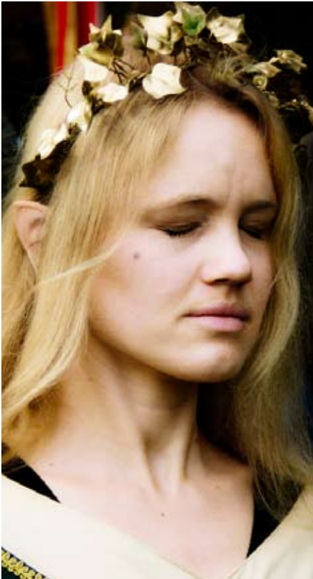
Geweihte in Trauer (Dagmar, NSC)

aber wohl schauen in welcher Gesellschaft und zu welchem Anlass. Unter seines gleichen kann ein Elb durchaus deutlich emotionaler handeln und sich mehr öffnen als unter Fremden.