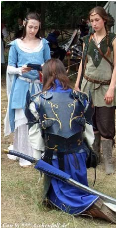
Illios schwört seinen Eid

Aufgrund des starken Bezugs zum Göttlichen und der Wahrung der göttlichen Ordnung ist das Volk Aurerijahrs in einer bestimmten Hierarchie eingeteilt. Diese gewährleistet, dass jeder Elb die Möglichkeit hat seiner Pflicht nachzukommen und dafür Respekt erhält, welcher ohnehin einen sehr hohen Stellenwert im Miteinander der Elben einnimmt.