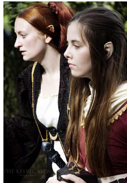
Geweihte und ihre jüngere Vertraute

Die Aurerijahrelben sind an sich ebenfalls unsterblich, wenn sie ihre Pflicht erfüllt haben und in das Götterreich zurückkehren. Jedoch ist ihr Leib in der sterblichen Welt durchaus vergänglich und somit die Zeit, in der sie ihr Schicksal erfüllen sollten, begrenzt. Hochelben haben durch ihre noch immer sehr enge Verbindung zum Unsterblichen Reich die längste Lebenserwartung, während das junge Volk der wilden Elben nicht älter als 1000 Jahre wird. Die genaue Auflistung findet ihr im Dokument "Elben Aurerijahrs".