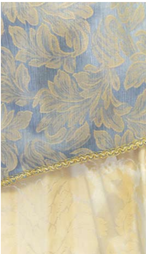
Beispiel für Pastellfarben einer hochelbischen Gewandung

Im Großen und Ganzen gibt es außer beißenden Neontönen bzw. sehr knalligen Nuancen (Pink, Neongrün, starkes Gelb ...) kaum Farben über die sich sagen lässt, dass sie unumgänglich "unelbisch" sind. Man kann fast alle Farbnuancen verwenden, wenn sie in das Gesamtkonzept und zum Charakter passen. Ein passendes Farbkonzept zu erstellen, setzt aber ein wenig Erfahrung voraus. Wenn ihr euch unsicher seid, greift für edle Kleidung zu den für Elben sehr typischen Pastelltönen und hellen Farben, für im Wald lebende Elben zu eher erdigen Tönen, die sich an der Natur orientieren.