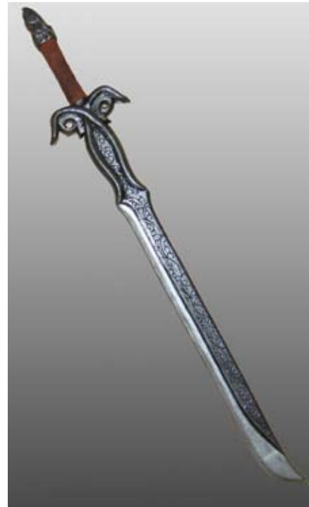
Schwert der Königin

Vermeidet hier eine moderne Optik (Sportbögen) und entscheidet euch besser für klassische Formen und schön gearbeitete Bögen aus Holz. Auch andere Materialien sind denkbar, sollten aber dann gut abgetarnt sein (z.B. mit einer Lederummantelung). Wer ein Händchen dafür hat, kann seinen Bogen leicht mit diversen elbischen Malereien bzw. Ornamenten verzieren.