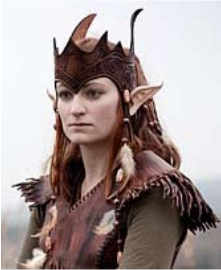
Fenya mit Helmalternative

Vollhelme sind im Design sehr anspruchsvoll, denn sie können schnell klobig und unpraktisch wirken, sind aber mit ein wenig Fingerspitzengefühl zur entsprechenden Rüstung durchaus denkbar.