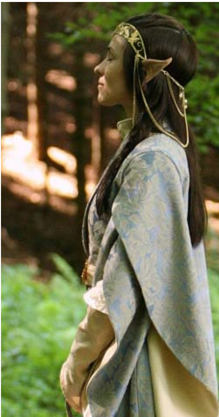
Zeit für Meditation (Lenora)

Mit der hohen Lebenserwartung ändern sich auch viele Verhaltensweisen im Gegensatz zu einem Menschen. Frei nach dem Motto “Elben haben Zeit” kann man das Spiel andersartig gestalten um dies zu reflektieren. Eine gewisse Ausgeglichenheit, Gelassenheit, aber auch Entrückung von der Welt sind nur einige Möglichkeiten.