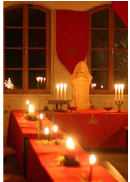
Lagerausstattung auf dem Aurerijahr 1

Das Lager selbst besteht aus Gegenständen aller Mitspieler und größtenteils dem Aurerijahrfundus. Zwar sind diese von allen Gruppenmitgliedern nutzbar, aber es ist wohl selbstverständlich, dass damit sorgsam umgegangen wird.