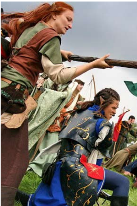
Kampf gegen die Orks

Der klassische Gegensatz von Gut und Böse ist für das Fantasygenre nicht wegzudenken und gehört in jede durchdachte, fantastische Welt. Solch eine klare Definierung des Spiels sollte nicht untergraben werden, da es sonst das Bild der Elben nach den bekannten Grundklischees als rechtschaffene oder gute Wesen oder auch jeder anderen bekannten Fantasyrasse verklärt.